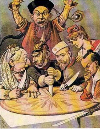
Figura 1. El reparto de China. Caricatura de 1895. Aparecen la reina de Inglaterra, el canciller alemán, el zar de Rusia, el emperador de Japón y atrás el emperador de China y la mujer que simboliza a Francia.