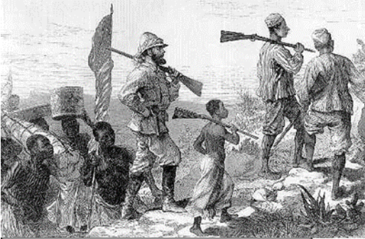
Figura 4. Ejército británico llegando a regiones africanas.

Sin embargo, como se había comentado, no era siempre necesario llevar ejércitos porque en el fondo lo que más interesaba era la expansión del capitalismo que podía conseguirse en esos lugares vendiendo las mercancías, adueñándose de las materias primas y explotando la mano de obra de los trabajadores, lo que podía lograrse con tratados comerciales, trucos políticos y presión diplomática, para convencer a los pobladores de los lugares conquistados de que Europa tenía la misión de llevar el progreso por el mundo y que los demás debían permitirselo, sin que fuera necesario invadir militarmente, es lo que se conoce como colonialismo.