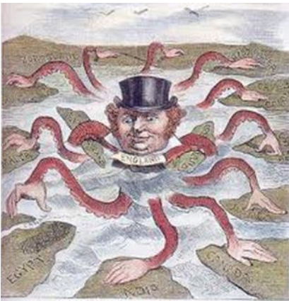
Figura 2. Imperio Británico. Caricatura de la época.