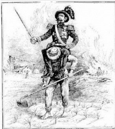
Figura 3. La carga del hombre blanco. Caricatura de la época.

El imperialismo se presenta desde el siglo XIX y se considera como la causa más importante de las guerras mundiales. De acuerdo con lo anterior, se entiende que llegaría un momento en que las naciones en las que se habían formado grandes