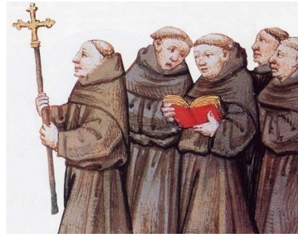
PODER DE LA IGLESIA